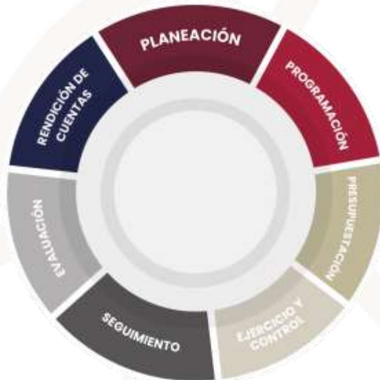
Esquema 1. Etapas del Ciclo Presupuestario